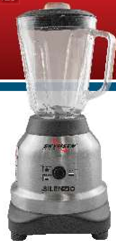
Blender Silenzio / Licuadora Silenzio

- BESIDES THIS EQUIPMENT, A COMPLETE RANGE OF OTHER PRODUCTS ARE MANUFACTURED, CONSULT OUR DEALERS - DUE TO THE CONSTANT IMPROVEMENTS INTRODUCED TO OUR EQUIPMENTS, THE INFORMATION CONTAINED IN THE PRESENT INSTRUCTION MANUAL MAY BE MODIFIED WITHOUT PREVIOUS NOTICE.