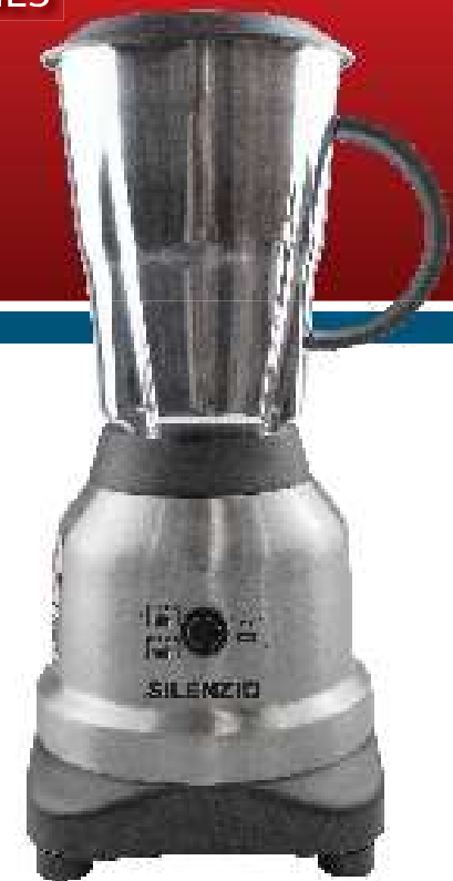
Blender Silenzio / Licuadora Silenzio

- BESIDES THIS EQUIPMENT, A COMPLETE RANGE OF OTHER PRODUCTS ARE MANUFACTURED, CONSULT OUR DEALERS - DUE TO THE CONSTANT IMPROVEMENTS INTRODUCED TO OUR EQUIPMENTS, THE INFORMATION CONTAINED IN THE PRESENT INSTRUCTION MANUAL MAY BE MODIFIED WITHOUT PREVIOUS NOTICE.