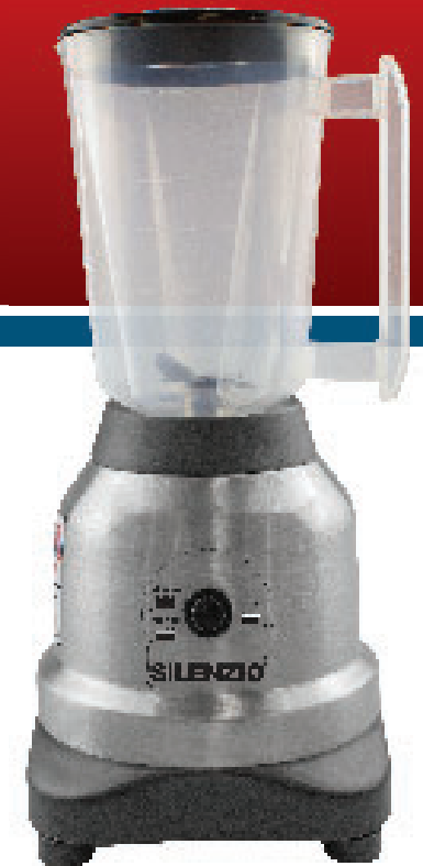
Blender Silenzio / Licuadora Silenzio

- BESIDES THIS EQUIPMENT, A COMPLETE RANGE OF OTHER PRODUCTS ARE MANUFACTURED, CONSULT OUR DEALERS - DUE TO THE CONSTANT IMPROVEMENTS INTRODUCED TO OUR EQUIPMENTS, THE INFORMATION CONTAINED IN THE PRESENT INSTRUCTION MANUAL MAY BE MODIFIED WITHOUT PREVIOUS NOTICE.